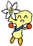
おぶちゃんマーク

15日(水)たご飯(郷土料理) 16日(木)知多3号たまねぎ(伝統野菜) 有機農業でできたじゃがいも