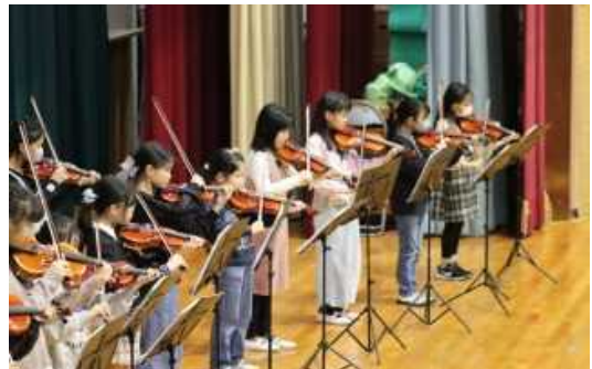
カルスポのみなさんによる演奏

1年のまとめとなる3月を迎えます。これまでの子どもたちの成長には、一人一人の努力があり、それを支えていただいた多くの方の励ましがあったと思います。ご家庭でも卒業や進級を機会に、これまでを振り返り成長したこと、できたことに目を向けて一緒に喜んでいただきたいと思います。