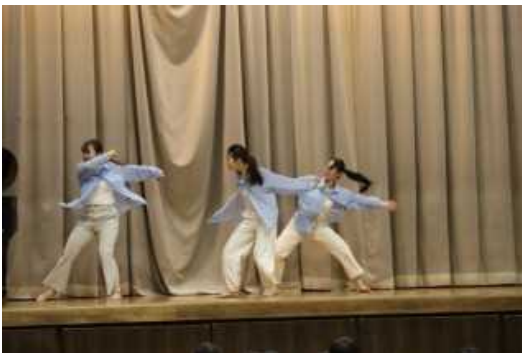
至学館大学の学生による創作ダンス

友達と考えや意見が違ってしまうことや失敗をしてしまうこともあります。学校では価値観や性格の違う子どもが活動し、その中でたくさんの「ありがとう」と「ごめんなさい」がありました。子どもたちは「ありがとう」や「ごめんなさい」の数だけ優しくなり、大きく成長しました。そして3月はたくさんの「さようなら」があります。その数だけ子どもたちに心をこめた思い（愛）を伝えられるようにしていきたいと思います。