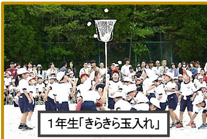
1年生「きらきら玉入れ」

来賓の皆様、保護者、ならびに地域の皆様にも温かい声援をいただきました。子どもたちも練習以上の力を発揮し、最後まで「笑顔」でがんばることができました。ありがとうございました。