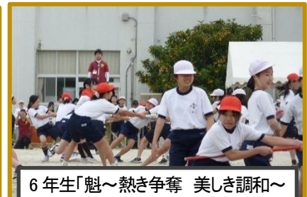
6年生「魁～熱き争奪 美しき調和～」