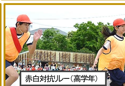
赤白対抗ルー(高学年)