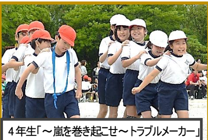
4年生「～嵐を巻き起こせ～トラブルメーカー」