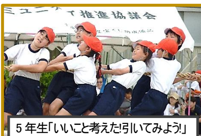
5年生「いいこと考えた引いてみよう!」