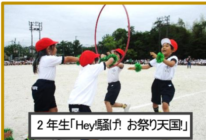
2年生「Hey!騒げ! お祭り天国!」