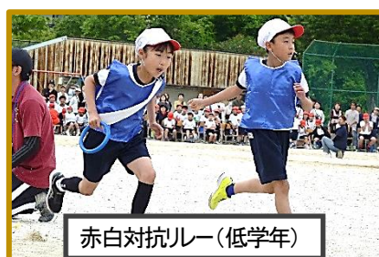
赤白対抗ルー(低学年)