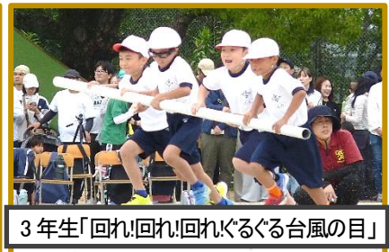
3年生「回れ!回れ!回れ!ぐるぐる台風の日!」