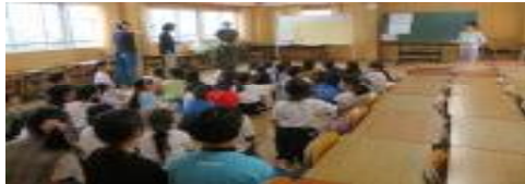
10/18 手話教室 手話劇「大きなかぶ」