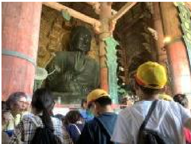
仏っちゃん講座の成果は出たかな？ 10/1, 2 修学旅行にて