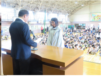
10/21 全校朝会 任命式及び表彰式