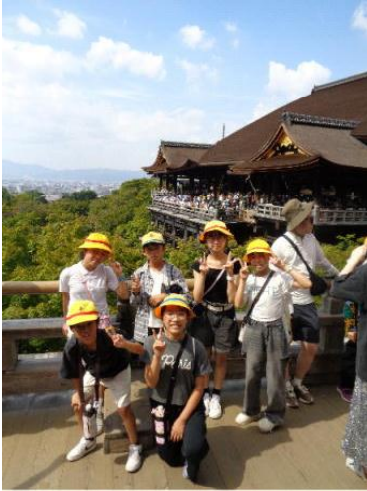
10/1, 2 修学旅行 清水寺にて世界遺産！