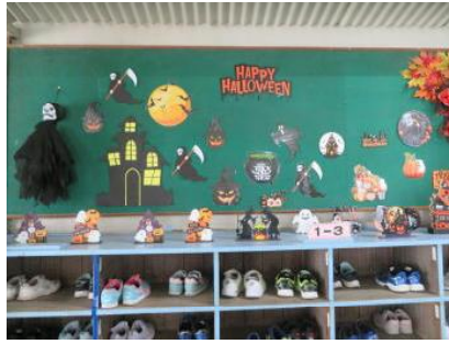
昇降口には、ハロウィーンの掲示物があります。全て、ALTの手作りです。