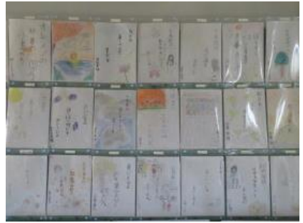
5年廊下には、秋に関する俳句が並んでいます。

これら以外にも、書写の展示や校外学習での訪問で発見したこと、虫の観察などの記録が掲載されています。ご来校の際には、ぜひ、ご覧ください。現在は、「おおぶっ子発表会」へ向けて、各学年、一生懸命、練習に励んでいます。お楽しみに！！