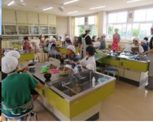
10/7, 8, 11 5年調理実習に PTA生活指導部のサポート