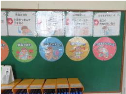
保健室前には、ひざをすりむいたときや鼻血が出たときの簡単な応急処置の方法が掲載されています。